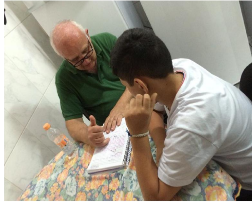
Reforço escolar de Matemática

“Ser criança é ter mil sonhos no coração e acreditar que todos eles são possíveis. É fazer do imaginário a sua realidade, brincar com bonecos como se eles tivessem vida e pular e correr como se fosse dotado dos poderes dos seus heróis preferidos”.