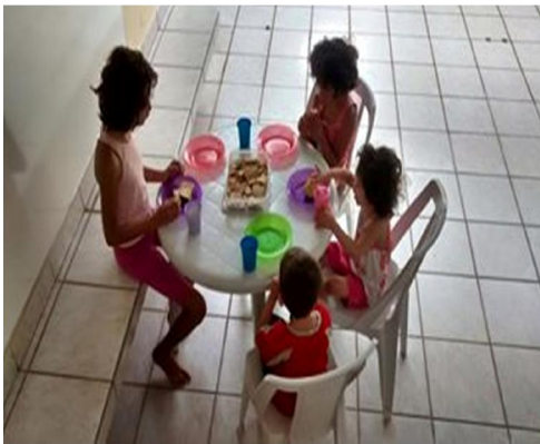
Hora do lanche

“É o segredo é ter muita fé para seguir em frente, mais coragem para enfrentar os obstáculos e a certeza de que quando os nossos sonhos são movidos por amor, a vitória não demora a chegar...”