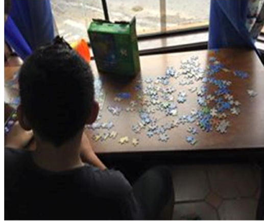
Quebrando a cabeça