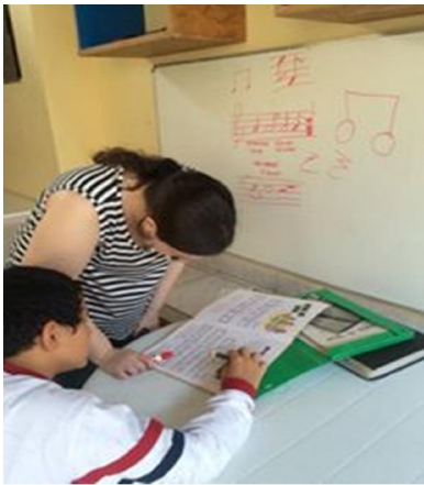
Aula teórica de piano