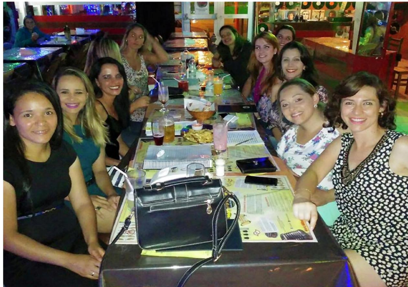
Confraternização da equipe Lar Casa Bela