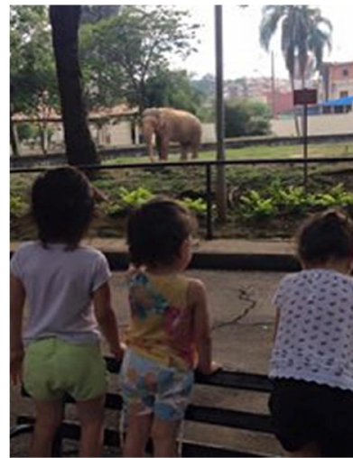
Passeio no zoológico de Sorocaba