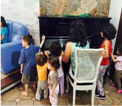
Ao som da música

Só existem dois dias no ano que nada pode ser feito. Um se chama ontem e o outro se chama amanhã, portanto hoje é o dia certo para amar, acreditar, fazer e principalmente viver.