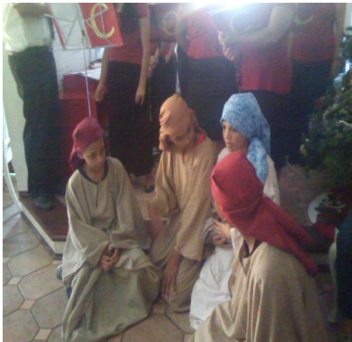
Encenação de Natal para as crianças e Família