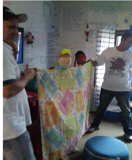
Fazendo estórias com fantoches