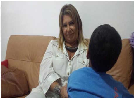
Atendimento da Fonoaudióloga

“Nos olhos de toda a criança se esconde o segredo da felicidade. O mundo é uma infinita fonte de descoberta e brincadeira, e seu sorriso fácil tudo descomplica e ilumina, em uma consciência onde ainda não existem definitivos”.