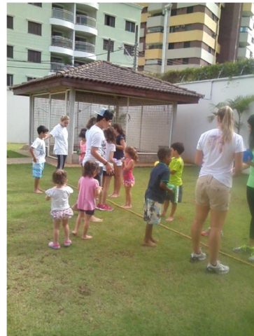
Um dia de piquenique e recreações ao ar livre