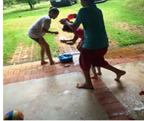
A felicidade não tem preço