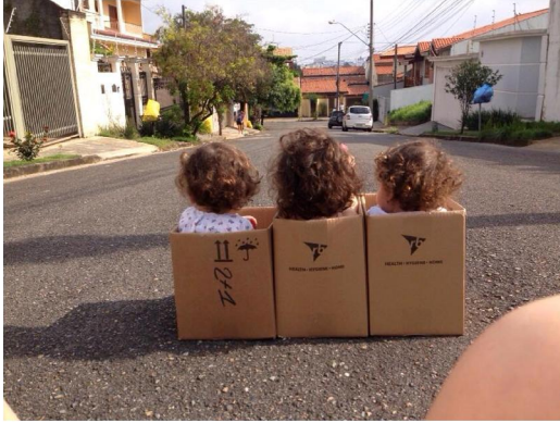
Usando a imaginação