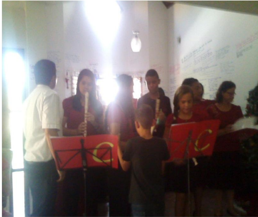
Cantata de Natal para as Crianças e Família