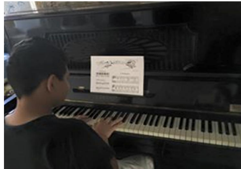
Aula prática de piano