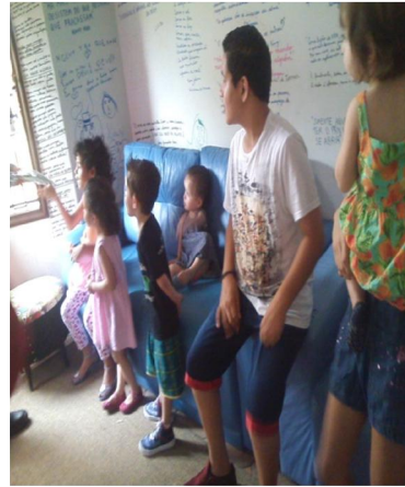
Visita do Papai Noel e entrega de presentes!!!