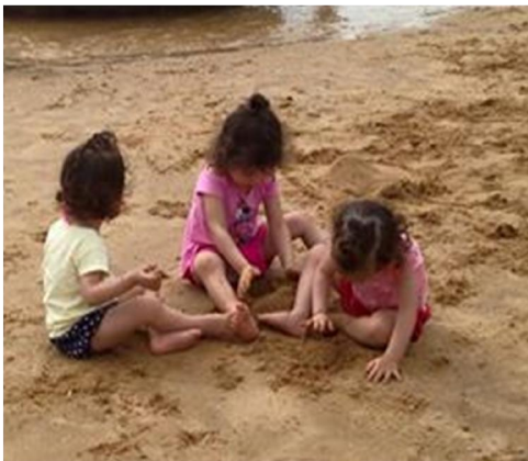
Porque se sujar faz bem