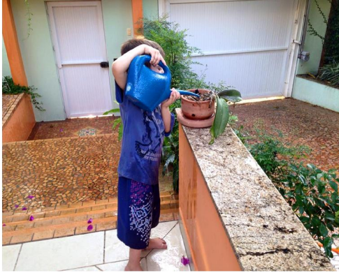
Cuidando das plantas