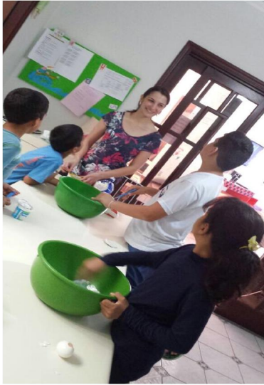
Aula de Culinária