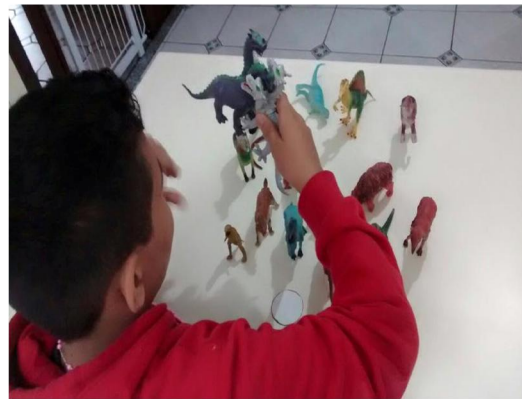
A “batalha” começou