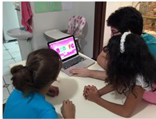
Aula de inglês