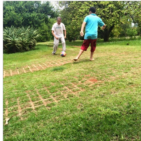
Hora da diversão

Que a felicidade não dependa do tempo, nem da paisagem, nem da sorte, nem do dinheiro. Que ela possa vir com toda simplicidade, de dentro para fora, de cada um para todos.