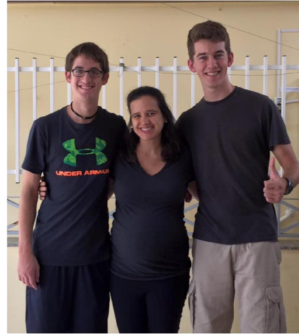
Trabalho voluntário com intercambistas

“É o segredo é ter muita fé para seguir em frente, mais coragem para enfrentar os obstáculos e a certeza de que quando os nossos sonhos são movidos por amor, a vitória não demora a chegar...”