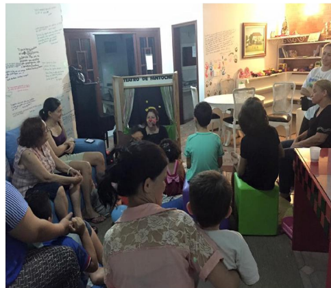
Teatro de fantoche com as crianças e suas famílias